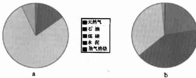
图3 中国(a)与美国(b)CO 2 排放构成

气候变化可能带来诸多不利的影响;我们又面临着不断增长的国际压力;此外,排放CO 2 等温室气体,从本质上是局地的大气污染,我们也面临着不断增长的各阶层人士和群众的减排呼吁,故气候变化既是科学问题,又是当代无法回避的政治、外交、环境和经济问题,如果处理不当,将会对我国未来几十年的可持续发展构成严重制约。在这种形势下,国家应把全球气候变化和局地大气污染问题结合起来考虑,统筹制订应对政策,迅速采取行动。